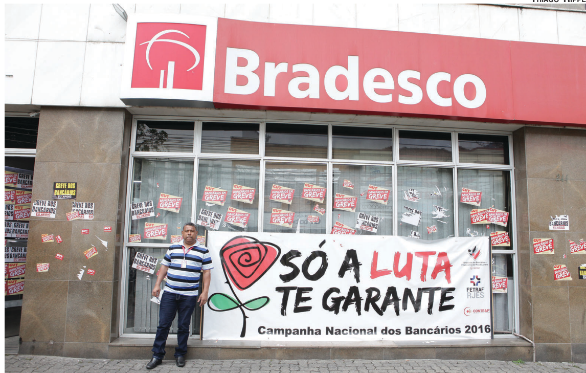
A greve cresceu nos bairros da Zona Norte, entre eles Vila Isabel, Maracanã, Praça da Bandeira, Penha, Pavuna e Olaria

A greve continua forte em todo o país. Ontem, 21º dia da paralisação, estavam paradas 13.420 agências e 33 centros administrativos. O número representa 57% das agências de todo o Brasil. Na cidade do Rio de Janeiro foram 411 agências paralisadas, número superior às 407 de sexta-feira passada. O movimento foi mais forte em bairros da Zona Norte, como, Pavuna, Penha, Olaria, Vila Isabel, Maracanã e na Praça da Bandeira, bem como em Campo Grande, na Zona Oeste, em bairros da Zona Sul, como a Glória e no Centro da Cidade. Estão com atividades suspensas, ainda, seis grandes prédios administrativos.