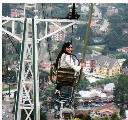
O passeio de teleférico é uma das atrações da bela cidade de Campos do Jordão, a mais famosa estância climática do Brasil

Para quem gosta de belas paisagens e uma temperatura incrivelmente agradável, o roteiro certo é Campos do Jordão, com sua natureza exuberante e um clima reconhecido internacionalmente como um dos melhores do mundo. O pacote inclui traslado em ônibus com ar-condicionado, banheiro, serviço de bordo e DVD. Além de duas noites em hotel com meia-pensão e passeios incríveis nos principais pontos turísticos da cidade. Os valores são: adulto R$870, e bancários sindicalizados, R$ 795. Mais informações, entrar em contato com a Secretaria de Cultura pelos telefones (21) 2103-4150/4151.