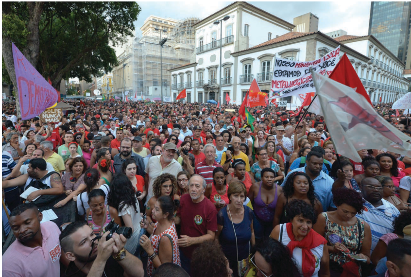
DEPENDE DE NÓS - Mobilização popular enfrenta a tentativa de golpe para garantir a democracia e os direitos dos trabalhadores