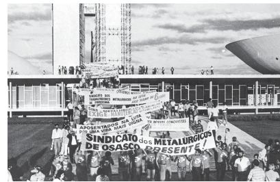
GOLPE CONTRA O POVO, O POVO CONTRA O GOLPE - Trabalhadores protestam contra o arrocho salarial

A ditadura militar não deixou apenas um lastro político de retrocesso e obscurantismo, com a prisão, exílio, tortura e assassinato de milhares de