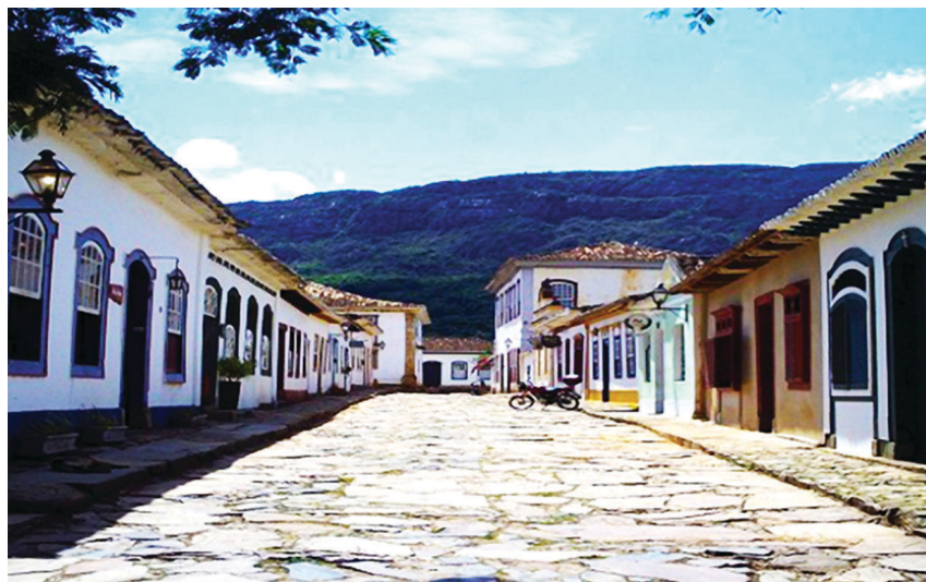
Tiradentes, em Minas Gerais, é uma volta ao passado histórico do Brasil Colônia

De 21 a 24 de abril, os bancários podem comemorar o Dia da Conjuração Mineira, na cidade histórica de Tiradentes. A concentração será às 7h, na Av. Marechal Floriano, 61, Centro. O traslado será em ônibus com ar-condicionado, banheiro e serviço de bordo. O passeio dá direito a três noites na Pousada Chafariz 4 Estações, com café da manhã, quatro refeições, passeio de trem (maria-fumaça) e city tour na cidade de São João del-Rei e Tiradentes. Adultos pagam R$950 e bancários sindicalizados, R$895. Inscrições 2103-4150/4151.