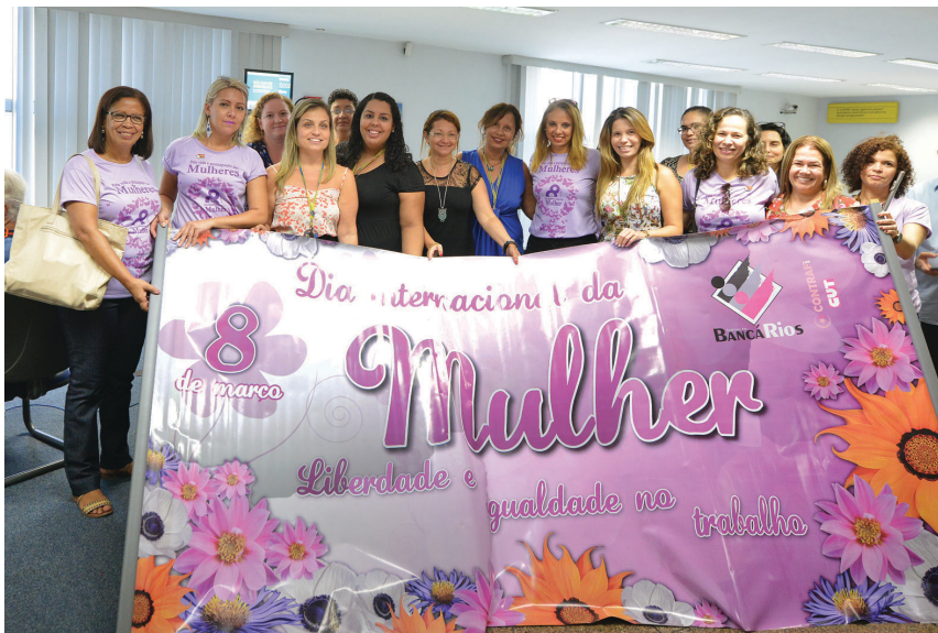
Na unidade Cinelândia do Banco do Brasil, funcionárias e sindicalistas posam com a faixa do Sindicato que pede “liberdade e igualdade no trabalho”