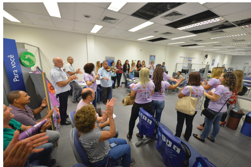
Em uma agência da Caixa, todos se emocionaram com declamação de poesia ao som de violino e flauta, na caravana do Sindicato, que teve excelente receptividade de toda a categoria

O Sindicato realizou na terça-feira, dia 8 de março, a tradicional caravana em homenagem ao Dia Internacional da Mulher. Sindicalistas percorreram agências do Centro e dialogaram com as bancárias a respeito da discriminação que ainda persiste no mercado de trabalho.