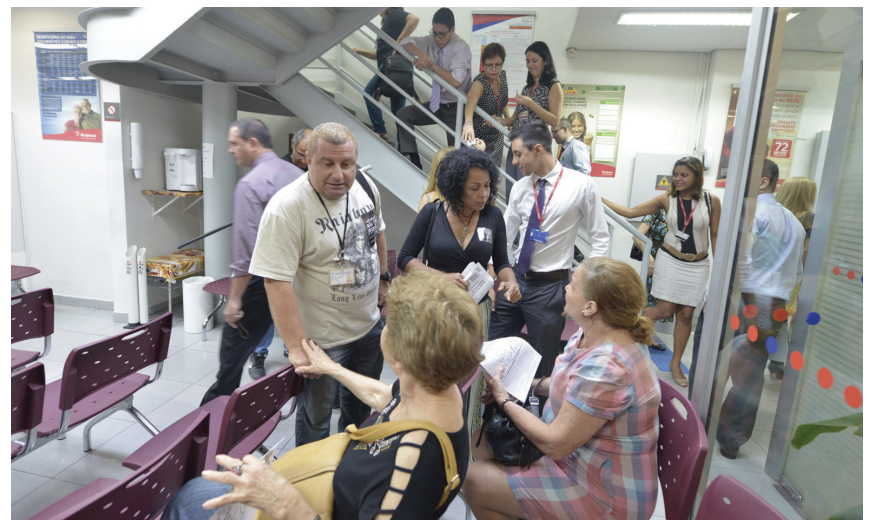
Na caravana do Flamengo e do Catete, sindicalistas dialogaram com a categoria e a população mostrando que os bancos é que forçam a categoria para a greve

O Sindicato do Rio realizou mais uma caravana nos bairros para convocar a categoria a participar das atividades da campanha nacional. O objetivo é intensificar a mobilização e organizar a greve, caso a Fenaban não apresente uma proposta decente na negociação desta sexta-feira, 25 em, São Paulo.