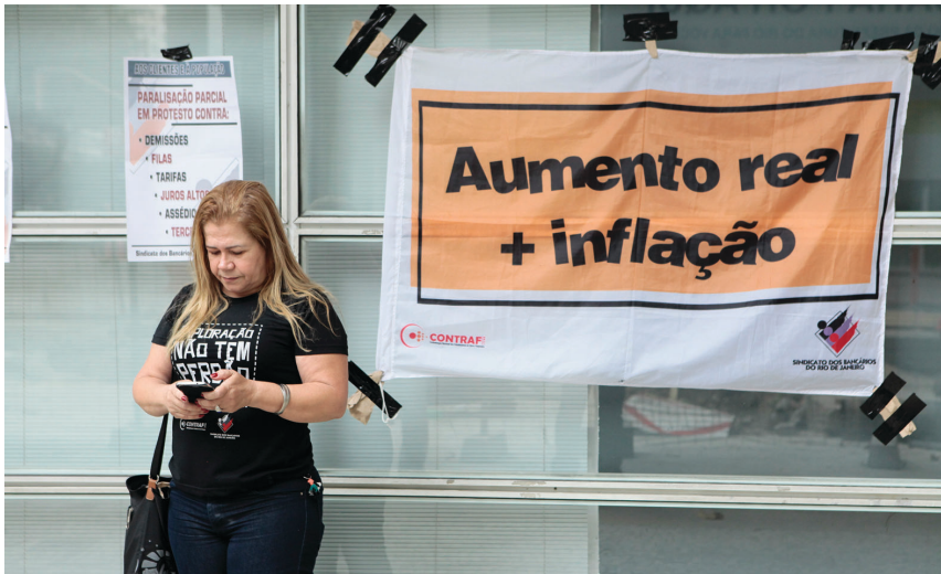
Os bancários do Rio pararam as agências da Rio Branco na quarta-feira, 23. A categoria mostrou disposição para entrar em greve, caso a Fenaban não avance nas negociações

Sindicato passa em caravana nos bairros e paralisa agências no Centro para convocar a categoria a organizar uma greve nacional forte e avançar nas negociações