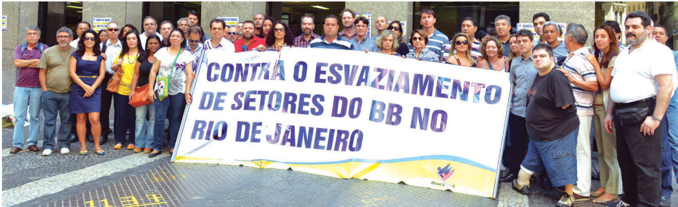
Funcionários do Banco do Brasil entendem que nada justifica a retirada da Gecex

O Banco do Brasil vem criando um clima de terror entre os funcionários da Gerência de Comércio Exterior (Gecex), para forçá-los a se retirar do setor que pretende desmontar. A prática procura tirar dos ombros da instituição a responsabilidade pelos prejuízos que serão causados ao funcionalismo, como transferências compulsórias e redução de salários.