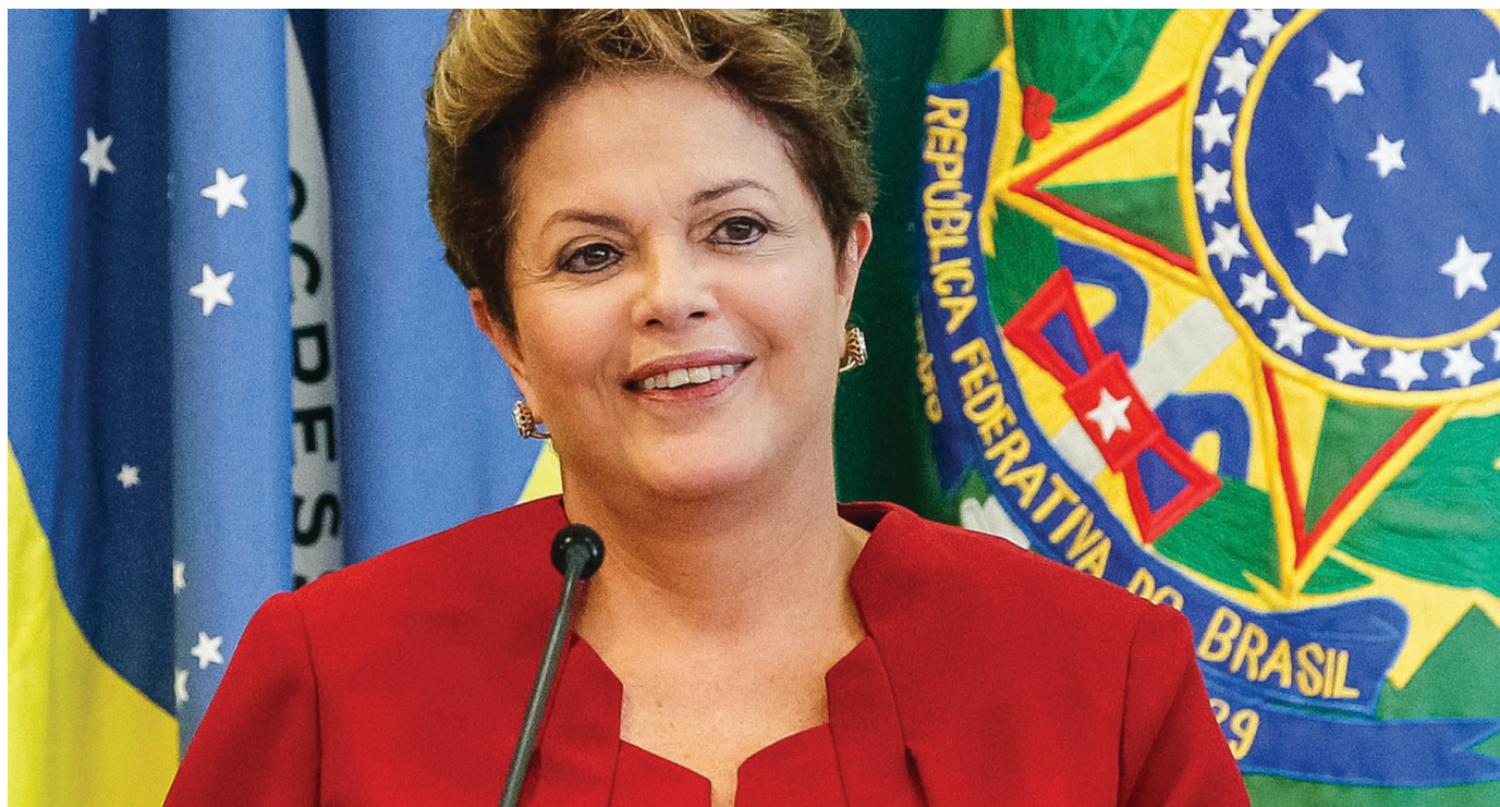
Em seu segundo mandato, a presidente Dilma enfrentará forte batalha no Congresso em relação ao PL 4330

Os ministros do Supremo julgarão se as empresas podem terceirizar suas principais atividades. O Tribunal Superior do Trabalho (TST), última ins-