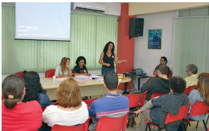
Sindicato deu posse aos delegados sindicais do BB no último dia 24

O movimento de resistência dos funcionários do Banco do Brasil à reestruturação do Centro de Serviços de Logística (CSL), no Andaraí, ganhou adesões importantes como o vereador Reimont Otoni (PT), o senador Lindberg (PT-RJ), os deputados federais Luiz Sérgio e Alessandro Molon, ambos do PT-RJ, os deputados estaduais Robson Leite (PT) e Paulo Ramos (PSOL) e o vereador Renato Cinco (PSOL).