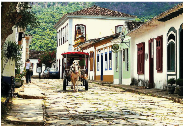
Passear de charrete pelas ruas de pedra de Tiradentes é uma volta ao passado histórico do Brasil

Ainda há vagas para a excursão às cidades mineiras de Tiradentes e São João del-Rei, interior de Minas Gerais. O passeio será realizado nos dias 12, 13 e 14 de setembro. Os bancários poderão conhecer algumas das principais cidades históricas do país e terão a oportunidade de comprar objetos de artesanato em Resende da Costa, além de um belo passeio de maria-fumaça, numa verdadeira volta ao passado. O pacote, que inclui meia-pensão e duas noites em hotel, custa R$545 para bancários sindicalizados e R$610 para convidados. Ligue para 2103-4150/4151 e garanta a sua vaga.