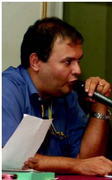
Marcello: "Exigimos nossos direitos"

Há que se lembrar também que uma das primeiras medidas administrativas de D. João VI foi a fundação do Banco do Brasil, no dia 12 de outubro de 1808, para a manutenção da monarquia. Assim, passavam pelo BB os negócios e os negociantes do novo reino. Com um capital de 1200 réis, era o quarto banco no mundo a emitir moeda, ao lado do Banco da Suécia (1668), Banco da Inglaterra (1694) e Banco da França (1800). Todos os negócios envolvendo, diamantes, pau-brasil, marfim, urzela (tinta para tecido) pas-