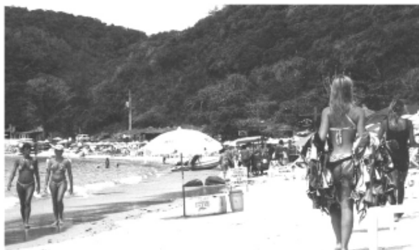
Búzios: cidade de praias paradisíacas, badalação e gente bonita

De 28 a 30 de março, a excursão é para a reserva natural de Grussaí, no norte fluminense. São duas