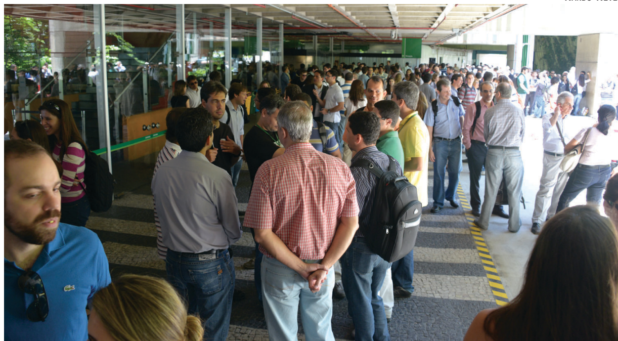
Últimos bancários ainda em campanha salarial, os funcionários do BNDES têm negociação nesta quinta-feira

“É muito bom ver e participar da mobilização dos empregados do BNDES, honrando a história de luta dos bancários, categoria da qual fazem parte. Por isso é importante que estejam nas próximas campanhas salariais unificadas”, disse.