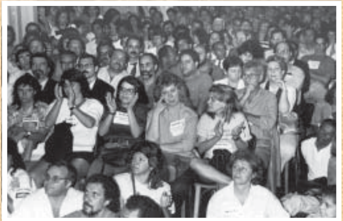
LÁGRIMAS E SANGUE – Banerjianos se emocionam em assembleia na Galeria dos Empregados do Comércio contra a privatização do banco