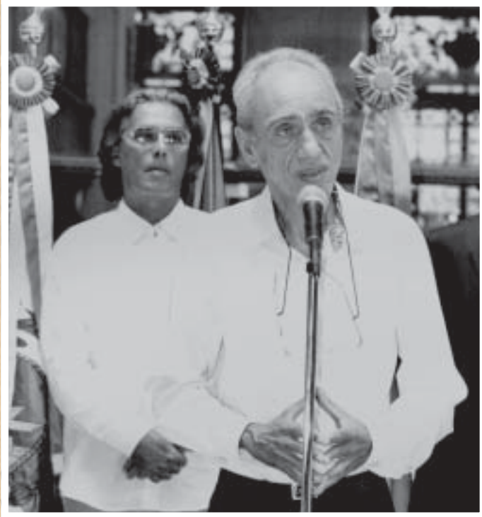
SOLIDARIEDADE – O Sindicato esteve ao lado de Betinho na luta contra a fome e a miséria