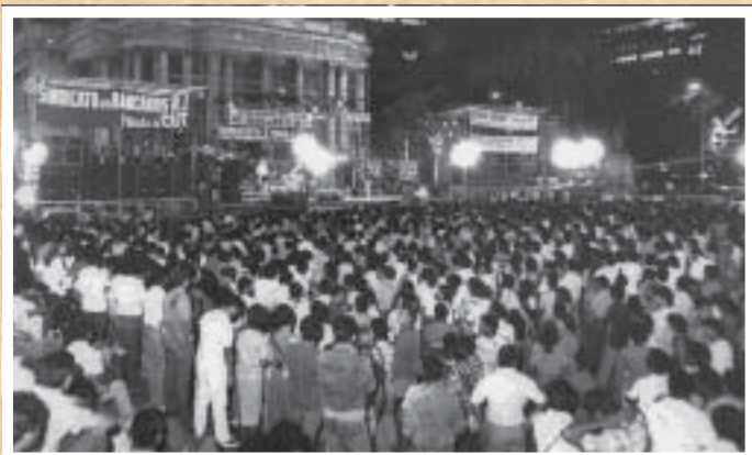
MOBILIZAÇÃO HISTÓRICA - Assembleia dos bancários luta a Cinelândia nos anos 80