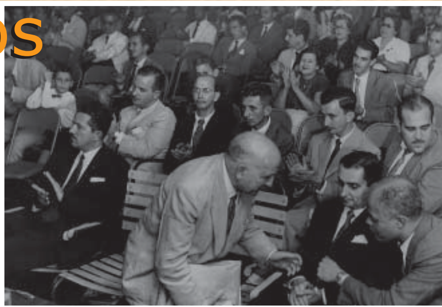
ANOS 50 - Posse da diretoria, em 1958

Arquivo de imagens resgata história do Sindicato dos Bancários do Rio