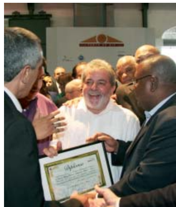
Vinicius de Assumpção (E) e Almir Aguiar com Lula. O presidente parabenizou todos os bancários e bancárias pelos 80 anos do Sindicato