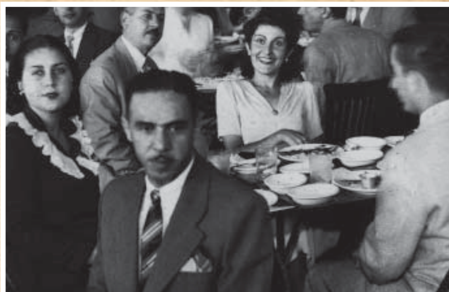
SEDE PRÓPRIA - Em 1943, o Sindicato decide investir numa sede própria e compra dois andares do prédio da Avenida Presidente Vargas, 502, na época ainda em construção. Bancários participam de almoço de confraternização