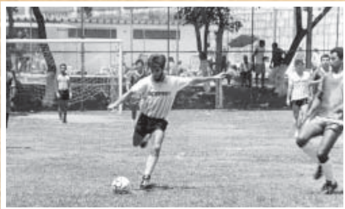
ESPORTES – A Copa Bancária é uma tradição de cerca de 20 anos na sede campestre