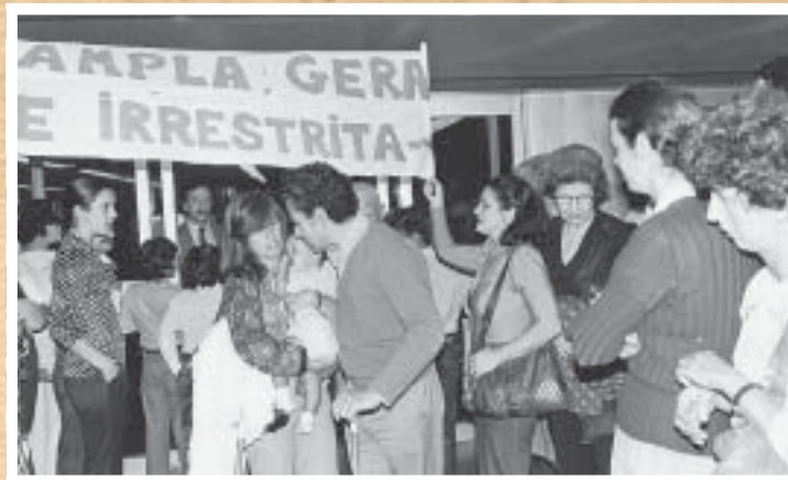
ANISTIA - Os bancários participam da luta em defesa da anistia e da redemocratização do Brasil