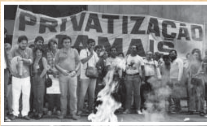
CONTRA A PRIVATIZAÇÃO - Luta contra o processo de privatizações já no governo Sarney