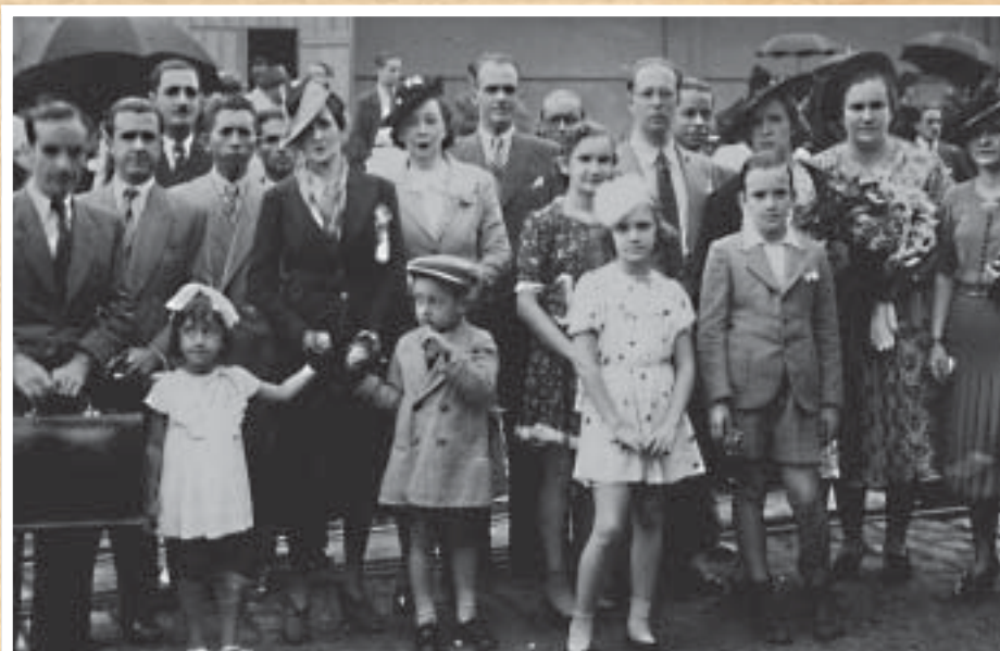
O NASCIMENTO - O Sindicato foi fundado no dia 17 de janeiro de 1930. Delegação carioca, nos anos 40, se prepara para um encontro da categoria em Recife

Na política, o Brasil sofria uma profunda transformação, através da revolução que levaria ao poder o presidente Getúlio Vargas. Para comemorar os 82 anos do Sindicato dos Bancários do Rio, publicamos parte de nosso extraordinário acervo histórico. O Centro de Memória do Sindicato já tem local e as obras já começaram no 16º andar da sede da entidade.