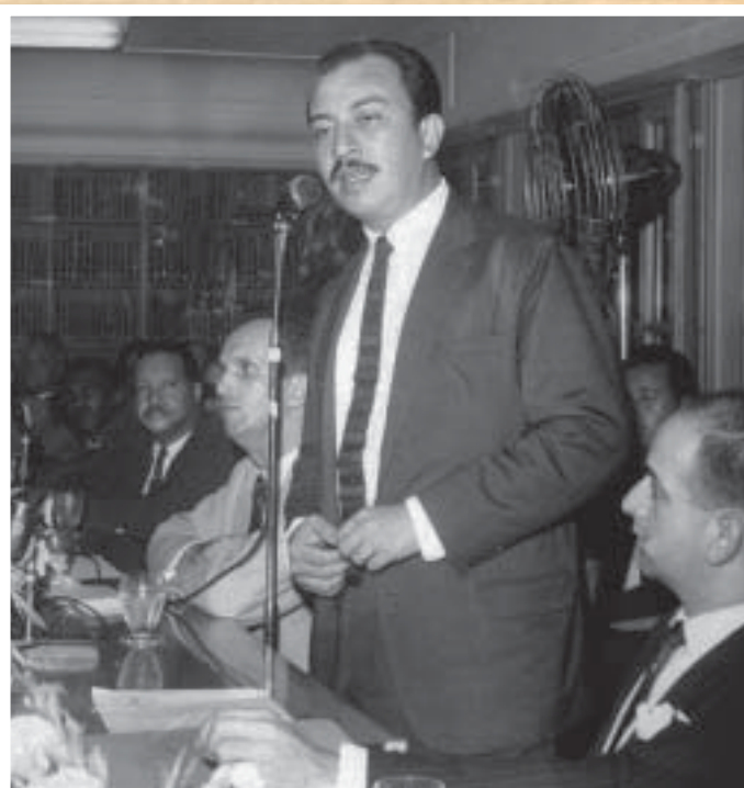
TRABALHISMO - O ministro do Trabalho do governo João Goulart, Almino Affonso (de pé), ouve o Sindicato na campanha salarial dos bancários