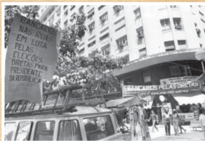
DIRETAS - Campanha pelas Diretas, Já. Comício na Candelária reúne mais de um milhão de pessoas