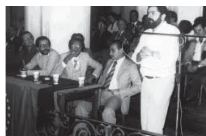
SEMPRE COM LULA - Lula discursa na posse da nova diretoria do Sindicato, em 1979