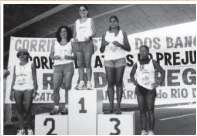
CORRENDO ATRÁS DO PREJUÍZO – A Corrida Rústica dos Bancários atrai atletas e amadores para a competição no Aterro do Flamengo