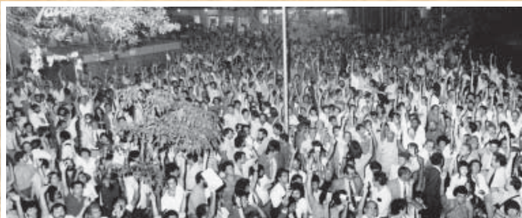
BANERJ - A categoria lutou contra a privatização de bancos públicos durante o governo FHC. Assembleia de banerjianos nas ruas do Rio