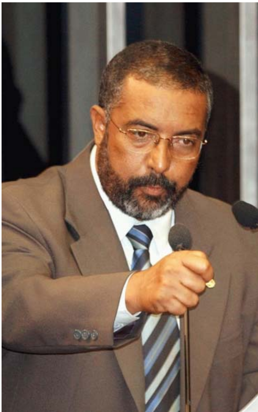
CORAGEM - O senador Paulo Paim (PT-RS) está na vanguarda das lutas em defesa dos trabalhadores no Congresso Nacional

Paulo Paim - Sou filho de um casal de operários já falecidos. Éramos dez irmãos. Aprendi desde pequeno sobre o valor da distribuição de renda. Afinal, meus pais recebiam apenas um salário