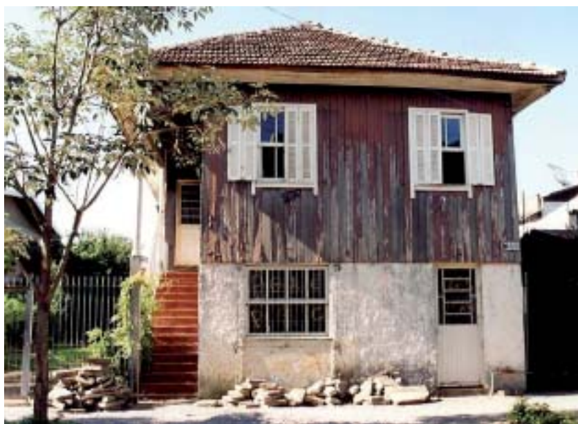
INFÂNCIA - A casa onde passou parte de sua infância, em Caxias do Sul (RS)

Paim – Dificuldades pelas quais grande parte de nossa gente passa. O preconceito por ser negro, pobre e operário. Pela falta de oportunidades e de dinheiro para enfrentar campanhas. Calculo como deve ser difícil para uma liderança se candidatar a vereador, a deputado ou a um cargo no Executivo se não tiver verbas. Até hoje enfrento inúmeras dificuldades. Dificuldades porque sou um parlamentar que tem sua marca na defesa dos trabalhadores, das pessoas com necessidades especiais, dos idosos, dos aposentados e pensionistas e daqueles