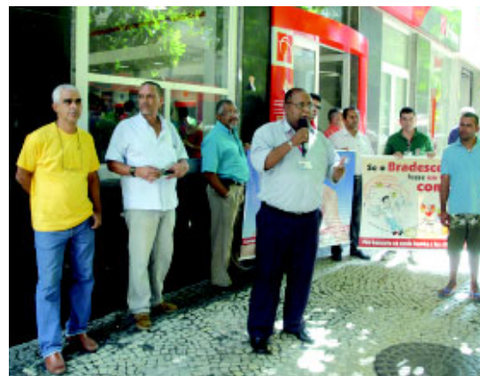
Protesto cobrou auxílio-educação, fim das filas e do assédio moral

Os bancários do Bradesco promoveram mobilizações em diversos estados, como parte do Dia Nacional de Luta, convocado pelos sindicatos e