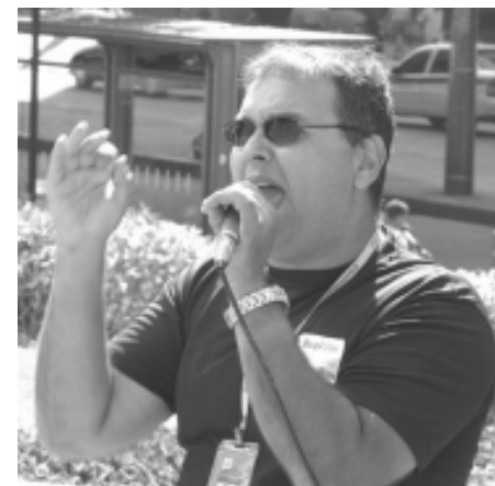
Marcelo: lucro dá ao BB condições de atender às reivindicações