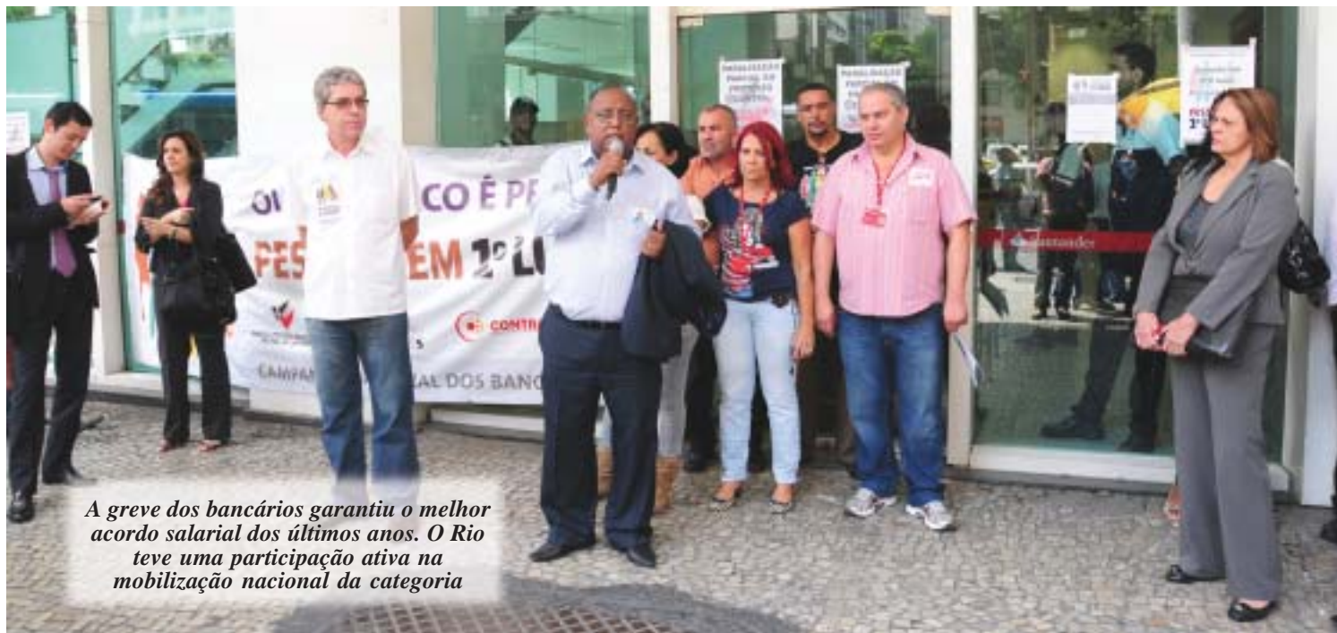
A greve dos bancários garantiu o melhor acordo salarial dos últimos anos. O Rio teve uma participação ativa na mobilização nacional da categoria