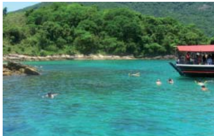
PARAÍSO NATURAL - Angra dos Reis possui belas ilhas, praias limpas e água cristalina

Algumas delas se destacam, como a Ilha dos Porcos, as Ilhas Botinas, que são o cartão postal da região, a Ilha de Itanhangá, que possui opções de trilhas, escaladas, canoagem e mergulho, e a Ilha Grande, a mais famosa de todas, repleta de aventuras e praias paradisíacas. A cidade está localizada na Costa Verde fluminense, entre os Estados de São Paulo e Rio de Janeiro, às margens da rodovia Rio-Santos (BR-101). Para conhecer bem este pedaço da Costa Verde fluminense, só mesmo com um passeio de barco, quando se pode observar o mar de águas cristalinas.