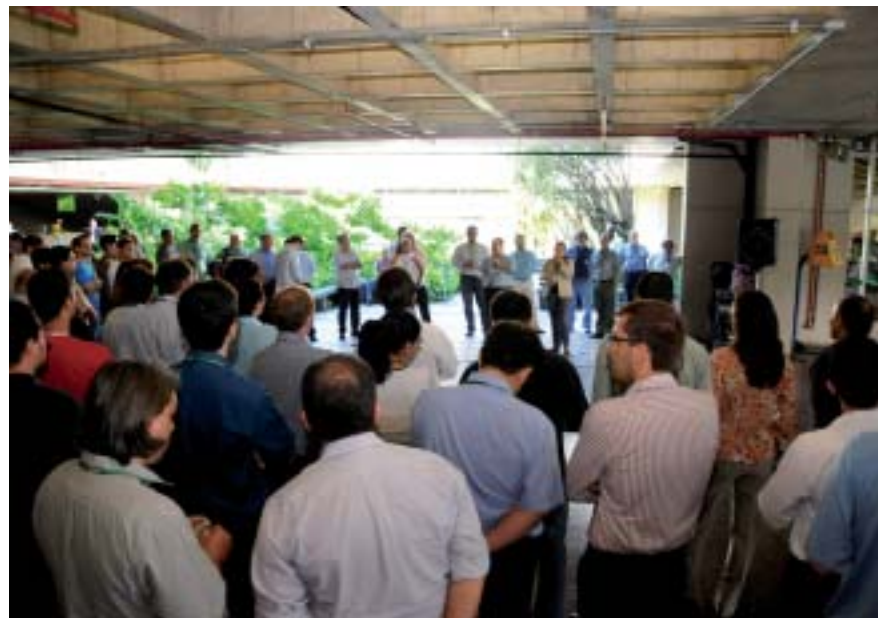
O Sindicato continuará dando todo o apoio ao movimento dos trabalhadores do BNDES