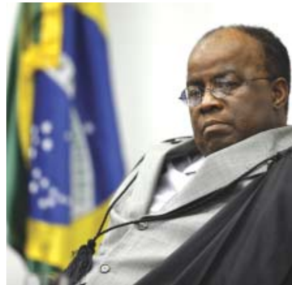
O ministro Joaquim Barbosa foi o relator da decisão do STF que anulou o interdito do Santander e garantiu o legítimo direito de greve dos bancários