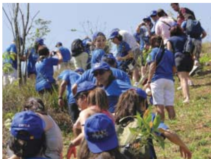
Os bancários participaram de uma caminhada ecológica, com plantio de mudas, em Xerém, no encerramento da Sipat

A necessidade de mudar a realidade da Caixa, onde há inúmeros problemas nesta área, tem feito com que o funciona-