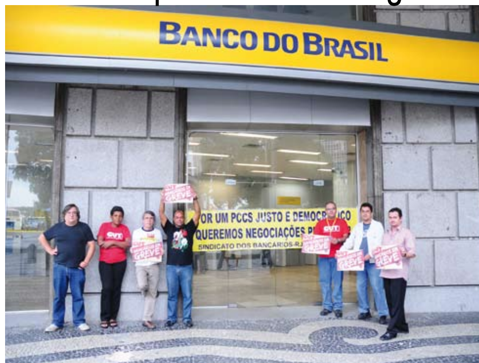
No Rio, os funcionários do BB paralisaram a agência Candelária por uma hora, como protesto pelo fato de a direção do banco não ter cumprido os acordos firmados com o funcionalismo em relação ao PCCS e o plano odontológico