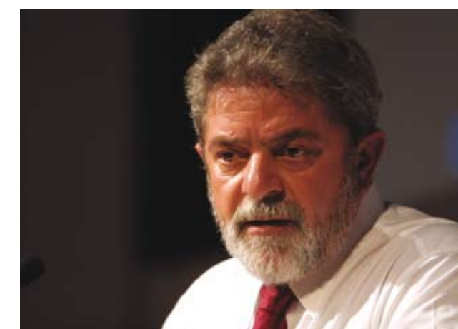
O presidente Luiz Inácio Lula da Silva enviou mensagem aos bancários do Rio, parabenizando a categoria pelos 80 anos do Sindicato