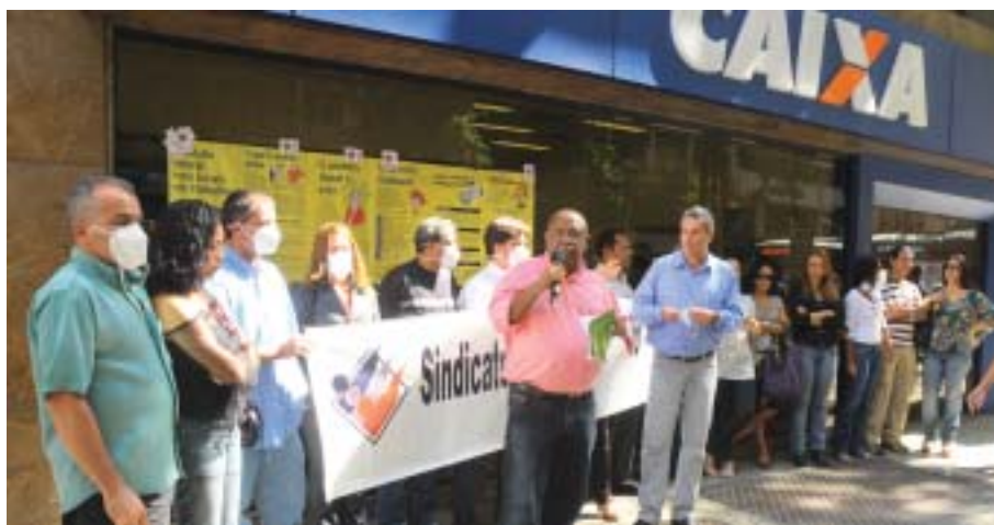
Diretores do Sindicato usam máscaras para denunciar a falta de um programa de prevenção à gripe suína nos bancos

No prédio da Caixa, na Avenida Almirante Barroso, já há um caso confirmado e dois suspeitos da doença