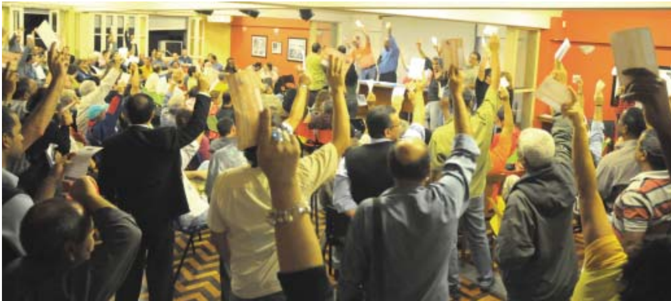
Os bancários do Rio, como mais de 90% dos bancários do Brasil, aprovaram a minuta de reivindicações consagrada na Conferência Nacional