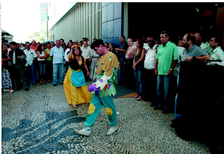
Manifestantes e clientes assistem à performance de atores em frente à Caixa durante o protesto

opinião diferente sobre a participação dos funcionários em greve. Para ela, uma situação de greve não deve ser vista como desvalorização do quadro