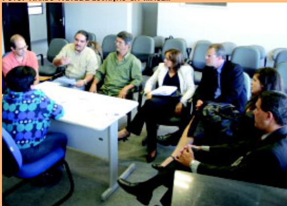
DESCRIÇÃO DA IMAGEM

Diretores do Sindicato solicitam à DRT fiscalização para a questão das horas extras trabalhadas no Feirão da Caixa