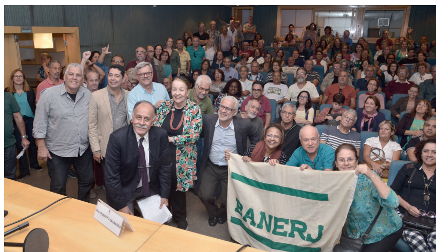
CASA CHEIA - O auditório da Alerj ficou cheio para a audiência pública sobre o PL 3213/2010, que trata de direitos previdenciários dos participantes da Previ/Banerj