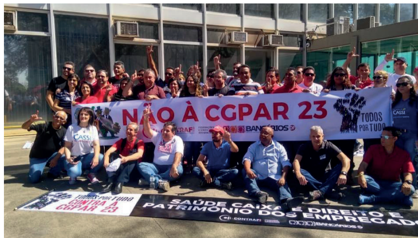
Bancários do Rio participaram do ato, em Brasília, em defesa dos direitos dos trabalhadores de empresas e bancos públicos.

Bancários de todo o país realizaram, na quarta-feira (15), em Brasília, um ato contra o desmonte e o projeto privatista que o governo Michel Temer impõe aos bancos públicos. A concentração da atividade começou às 10h, em frente ao Ministério da Fazenda, na capital federal. Trabalhadores de várias categorias, organizados no Comitê Nacional em Defesa das Empresas Públicas, também aderiram à manifestação. Bancários do Rio participaram da mobilização. Os trabalhadores protestaram contra as resoluções 22 e 23 da Comissão Interministerial de Governança Corporativa e de Administração de Participações Societárias da União (CGPAR). De acordo com as resolu-