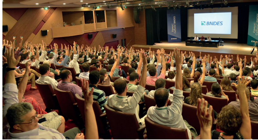
Funcionários do BNDERS aprovam acordo referente à jornada de trabalho e férias

Os funcionários do BNDERS aprovaram em assembleia, realizada na segunda-feira, dia 5, no auditório Arino Ramos Ferreira, no edifício do banco, na Avenida Chile, no Centro, o acordo coletivo