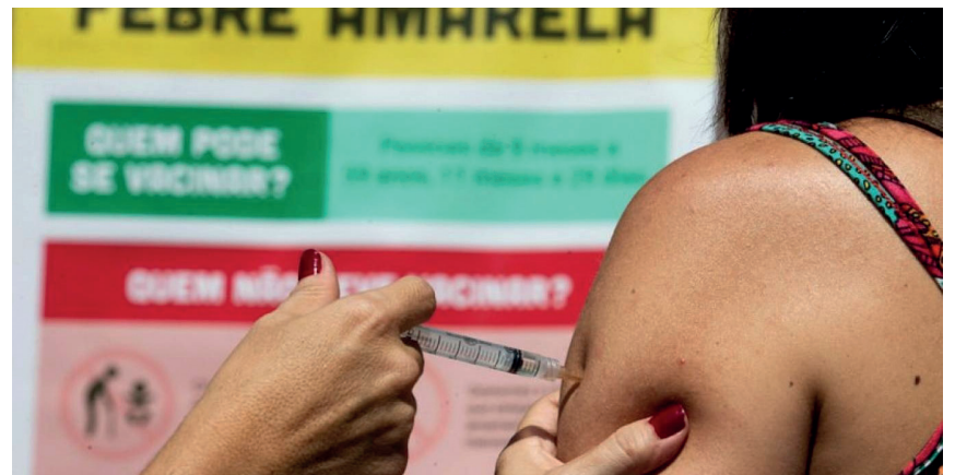
O Sindicato participa da campanha contra a febre amarela, em mais uma ação de cidadania

Pacientes com histórico de reações alérgicas às substâncias presentes na vacina, como por exemplo, ovo de galinha e seus derivados, também não podem se vacinar. Assim como pacientes com