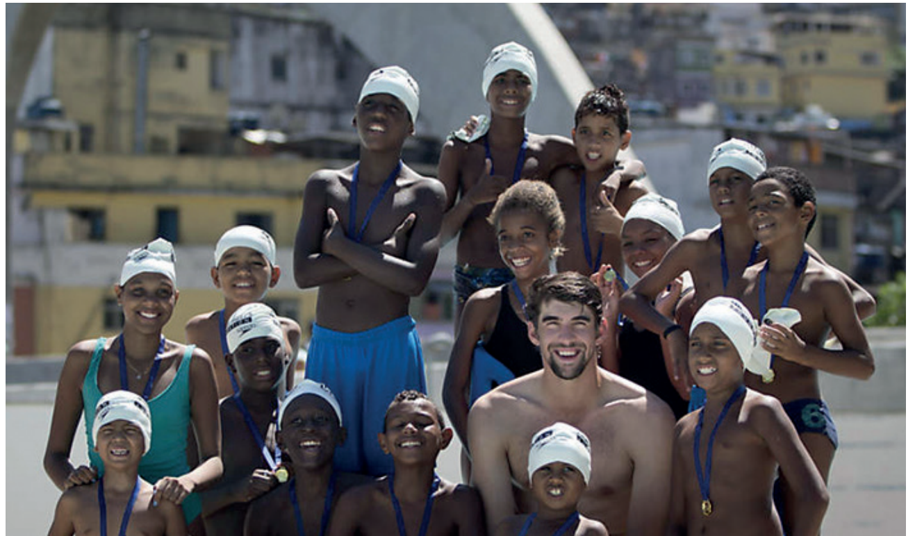
JUSTIÇA SOCIAL - Educação pública em horário integral, saúde, pleno emprego, geração de renda, esporte, cultura e lazer combatem a raiz do problema da segurança pública. A rua é a escola do crime.

É bom lembrar também, que os excessos cometidos por forças coercitivas, que têm uma tradição arbitrária, como a polícia e o Exército, costuma cometer abusos contra os pobres, como a decisão do mandado coletivo de apreensão e buscas, sempre nas favelas e periferias, onde está o varejo do tráfico, nunca nas mansões e condomínios da Zona Sul e Barra da Tijuca, onde só uma decisão judicial permite este tipo de ação. Como muito bem disse o jornal Meia Hora em sua manchete: “mandado de apreensão e busca na casa dos outros é fresquinho. Quero ver é fazer isso nas mansões dos barões do tráfico”.