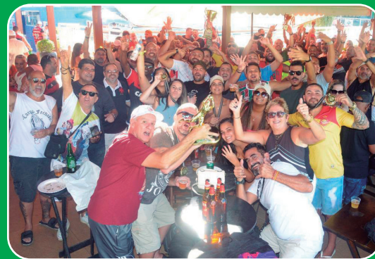
Athletas, torcedores e dirigentes sindicais na confraternização após as partidas das finais da Copa Bancária