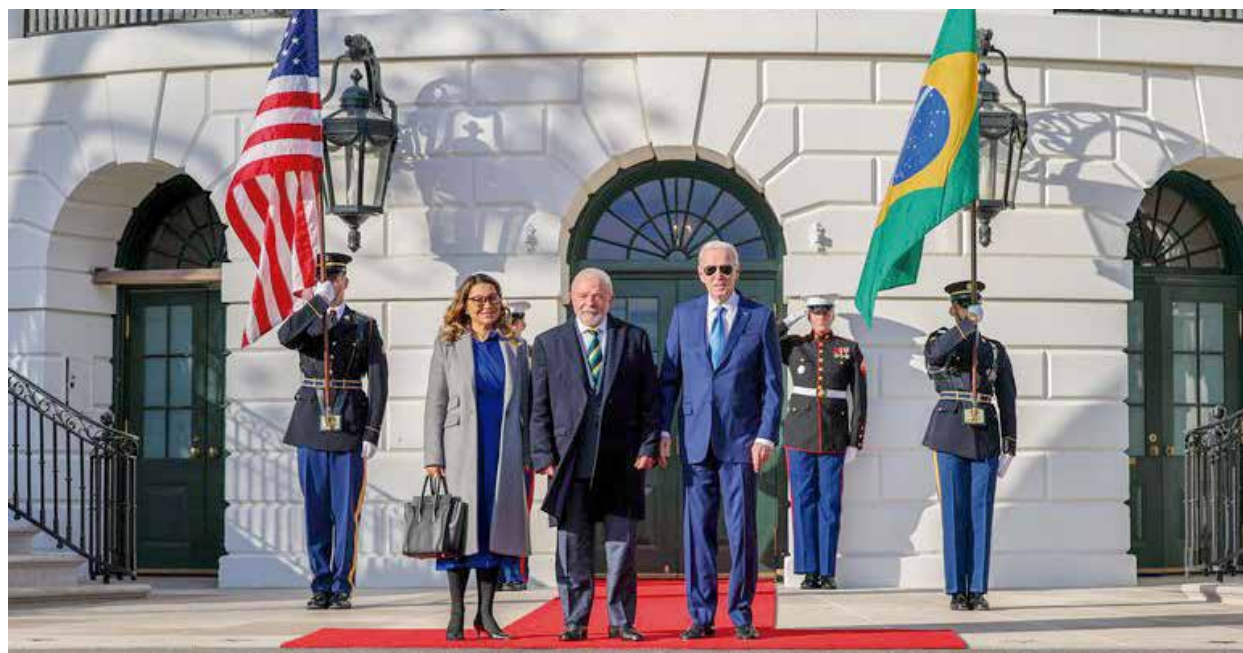
PONTOS EM COMUM - Joe Biden com Lula, na visita do presidente brasileiro aos EUA. Ambos os líderes defendem sindicatos fortes, taxaço dos mais ricos e financiamento de programas sociais

Ao contrário do que dissemina a direita no Brasil, sindicatos fortes são fundamentais para o desenvolvimento econômico de qualquer país capitalista