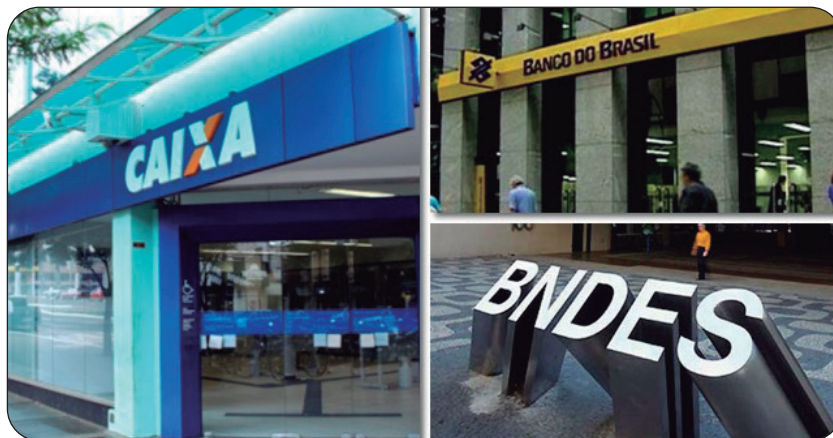
O Sindicato continuará sua luta histórica em defesa do fortalecimento dos bancos públicos, do emprego e direitos de toda a categoria

reira é motivo de comemoração também o fim do projeto privatista do atual governo, que chega ao fim no dia 31 de dezembro. Ressaltou ainda que a autonomia do movimento sindical está mantida.