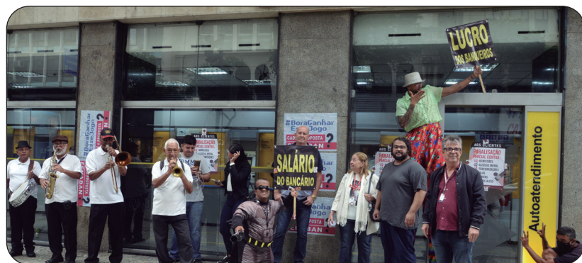
Os acordos coletivos dos bancários da Caixa Econômica Federal e do Banco do Brasil foram garantidos pela luta e unidade da categoria

O banco chegou a ameaçar com a retirada de direitos e o mais impactante seria a redução dos ciclos avaliatórios da GDP (Gestão de Desempenho Profissional) de três para apenas um, uma ameaça de descomissionamento, mas os funcionários e os sindicatos conseguiram preservar o atual modelo de avaliação. Outra conquista foi garantir o debate de temas importantes nas mesas permanentes como teletrabalho, a própria GDP, questões relativas ao PSO (Plataforma de Suporte Operacional), CRBBs