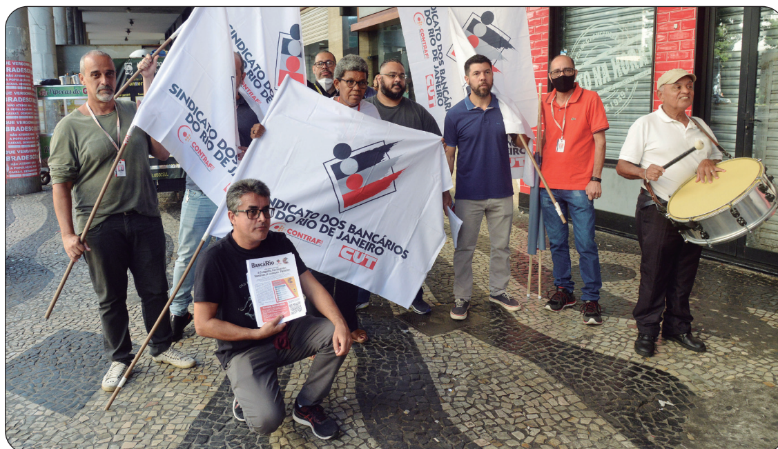
Dirigentes sindicais vão às ruas e distribuem o Jornal Bancário nas agências durante a campanha salarial: importância de sindicalização e participação para garantir conquistas e preservar direitos