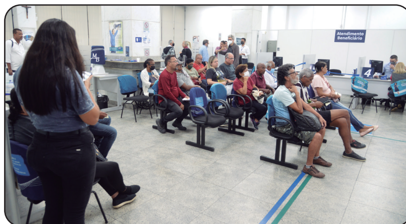
Clientes ficaram indignados com a notícia do fechamento da agência do Mercantil no Rio. Os dirigentes sindicais protestaram