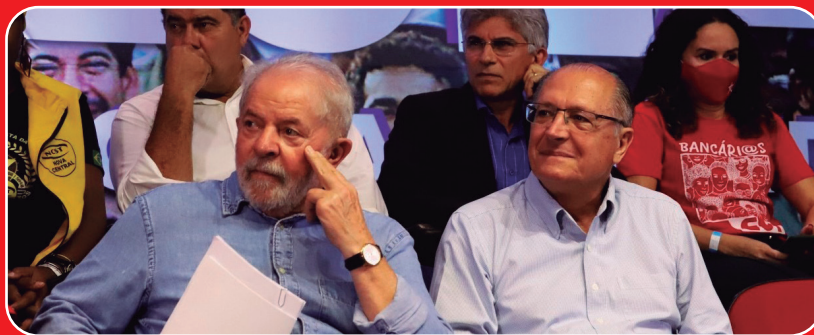
Lula e Alckmin apostam na união dos trabalhadores e do empresariado do setor produtivo para recuperar o desenvolvimento social e econômico do Brasil

O presidente nacional da CUT, Sérgio Nobre, saudou a presença de Lula e do possível candidato a vice-presidente na chapa do PT, Geraldo Alckmin (PSB). Alckmin disse que este encontro foi um dia histórico, reunindo as maiores centrais sindicais do Brasil, destacando a importância da união do