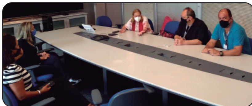
Diretores do Sindicato em negociação na Cesup

A Cesup explicou que são enviados sistematicamente aos gestores de agências, escritórios