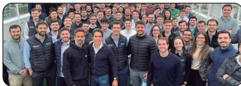
RACISMO EXPLÍCITO - XP Investimentos: sem negros em seu quadro funcional

Que o mercado de trabalho, inclusive do setor bancário discrimina negros e negras, todo mundo já sabe. Mas chegar ao ponto de não ter nenhum afrodescendente em seu quadro de funcionários, aí então há uma discriminação racial explícita. É o caso da Avel XP Investimentos, que só possui brancos em seu quadro funcional. O Ministério Público Federal deu parecer favorável à ONG Educafro, que provou não ha-