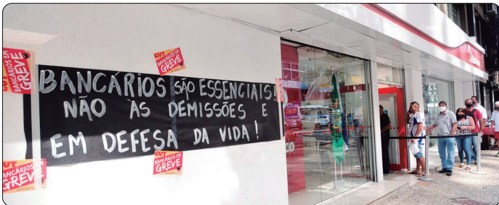
Sindicatos de todo o país protestam contra as demissões e o fechamento de agências físicas com paralisações e campanhas nas redes sociais

Ganhos do Itaú, Bradesco e Santander crescem 28,5% no 3º trimestre, totalizando R$17,9 bilhões