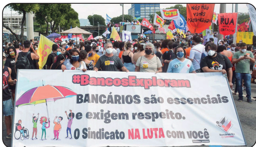
No Rio, os bancários participaram dos protestos contra o Governo Bolsonaro e cobraram a inclusão da categoria como prioritária no Plano Nacional de Imunização

detalhes da posse em nosso site e na página 4 desta edição, os protestos do povo brasileiro contra Bolsonaro.