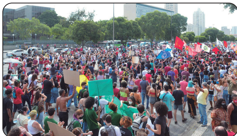
Com um número de participantes acima do esperado, uma multidão percorreu a Avenida Presidente Vargas e pediu o impeachment de Bolsonaro