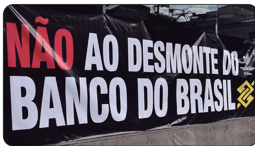
O Sindicato vai continuar denunciando os ataques do Governo Bolsonaro ao patrimônio público e o desmonte imposto pela direção do Banco do Brasil