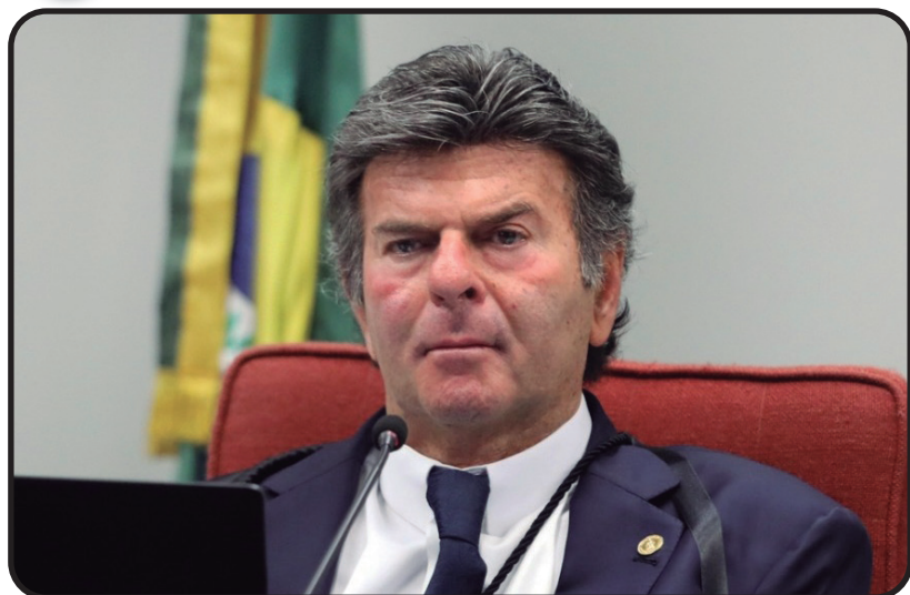
O presidente do STF, Luiz Fux, retirou da pauta a ação que trata da correção do FGTS, que estava prevista para a próxima quinta-feira (13)

A Ação Direta de Inconstitucionalidade foi apresentada em 2014 e alega que os indexadores usados para corrigir anualmente o saldo das