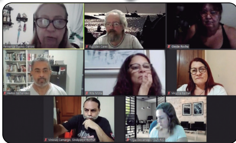
Plenária: é preciso unificar para derrotar entrega de empresas públicas ao setor privado

Em função da pandemia, foi sugerida a realização de plenárias por aplicativos mais amplas com a participação de dirigentes de entidades sindicais e de 'plenarões' para os quais seriam convocadas as diversas categorias.