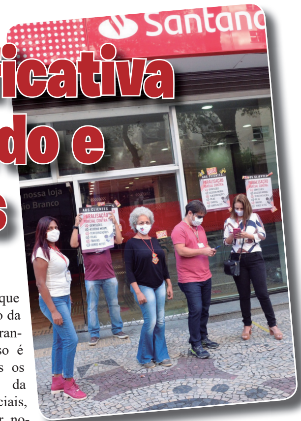
imagem dos bancos, que repercute no patrimônio da empresa e preocupa grandes acionistas. Por isso é fundamental que todos os bancários participem da campanha nas redes sociais, podendo inclusive usar novos perfis e pedir ajuda a amigos e familiares. Seja solidário a quem perdeu seu emprego.

Lutar por quem foi demitido hoje é garantir o seu emprego amanhã. Participe.