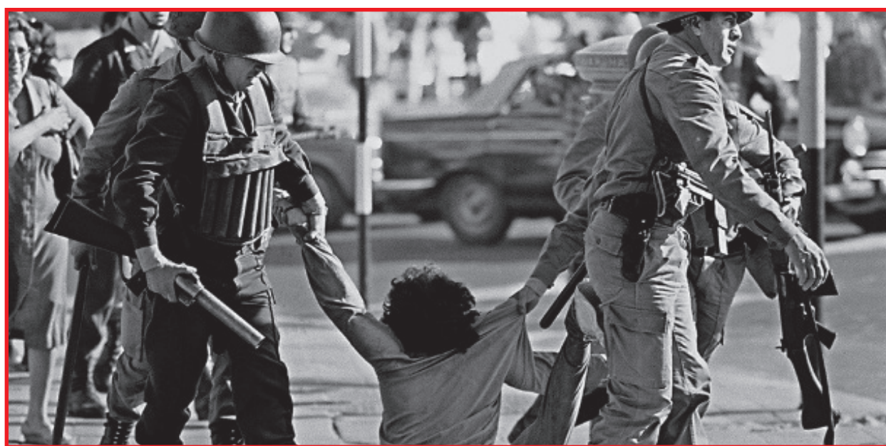
Bolsonaro apoia ditadura que jogou o Brasil nas sombras entre 1964 e 1985

A vala foi utilizada para enterrar corpos não identifica-