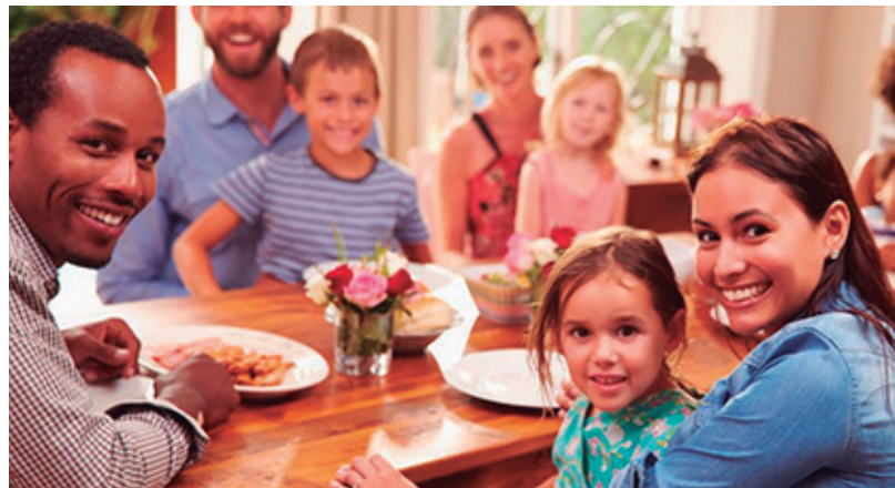
Descanso remunerado nos finais de semana para relaxar, se divertir e estar mais tempo com a família. A negociação dos sindicatos com a Fenaban foi um avanço que garante direitos fundamentais da categoria

Na última terça-feira, 26, os Sindicatos conseguiram um avanço importante nas negociações com a Fenaban (Federação Nacional dos Bancos), após a mobilização nacional da categoria e a pressão dos sindicatos.