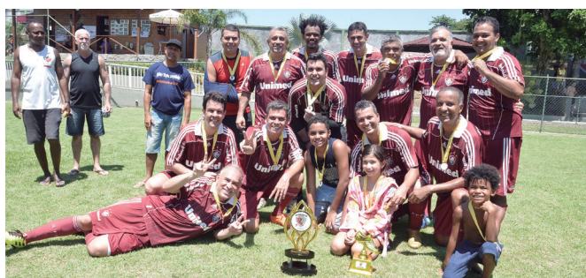
A equipe do Guerreiros celebra o título no gramado do Pereirão

No último sábado (22) a sede Campestre foi palco das finais da Copa Bancária. A equipe do Bradesco Guerreiros, sagrou-se bicampeã na categoria veterana, vencendo o Unibanco Uniamigos na disputa por pênaltis. Já o Bradesco Resenha, foi o vencedor do título do amador pela primeira vez, ao golear o Itáú Brahmeiros por 3 a 0.