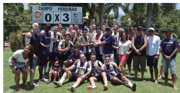
O time do Resenha comemora a conquista com a família