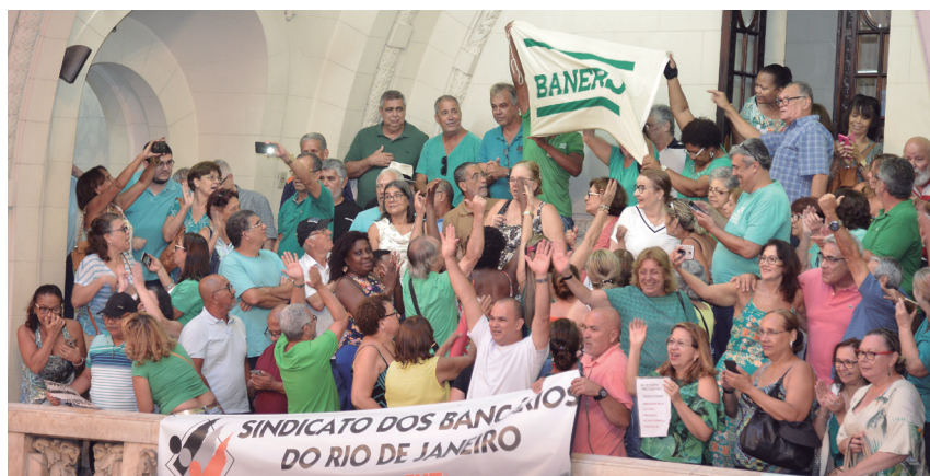
Galerias ficaram lotadas para pressionar na hora da votação