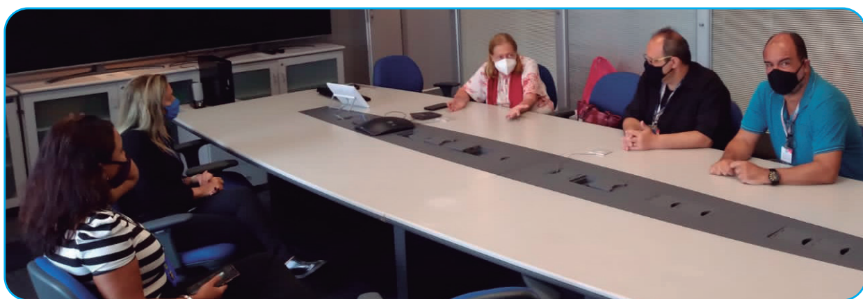
Sindicato cobra do BB respeito ao protocolo da Covid 19 e conserto de ar-condicionado

O cotidiano estressante nas Agências, Escritórios Exclusivos e Escritórios Leves (que de leves nada tem), não é novidade, porém, o que temos verificado nos últimos anos é extremamente preocupante: o aumento do assédio moral e o adoecimento psíquico da categoria.