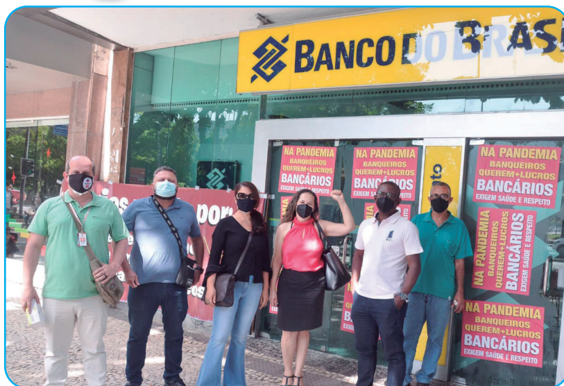
Sindicato na defesa da saúde e da vida

A equação é simples: o aumento da quantidade de trabalho com a redução de pessoal, acarreta excesso de trabalho. A má distribuição dos funcionários entre os PSO faz com que se trabalhe em vários locais no mesmo dia, e não são